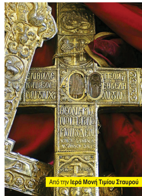
Από την Ιερά Μονή Τιμίου Σταυρού

Στη Λεμεσό μένουν πλέον μόνιμα πολλοί ξένοι, 10.000 περίπου είναι μόνο οι Ρώσοι, με αποτέλεσμα να έχουν αυξηθεί οι τιμές των ακινήτων και, όπως μας είπαν, οι ντόπιοι να δυσκολεύονται να βρουν κατοικία.