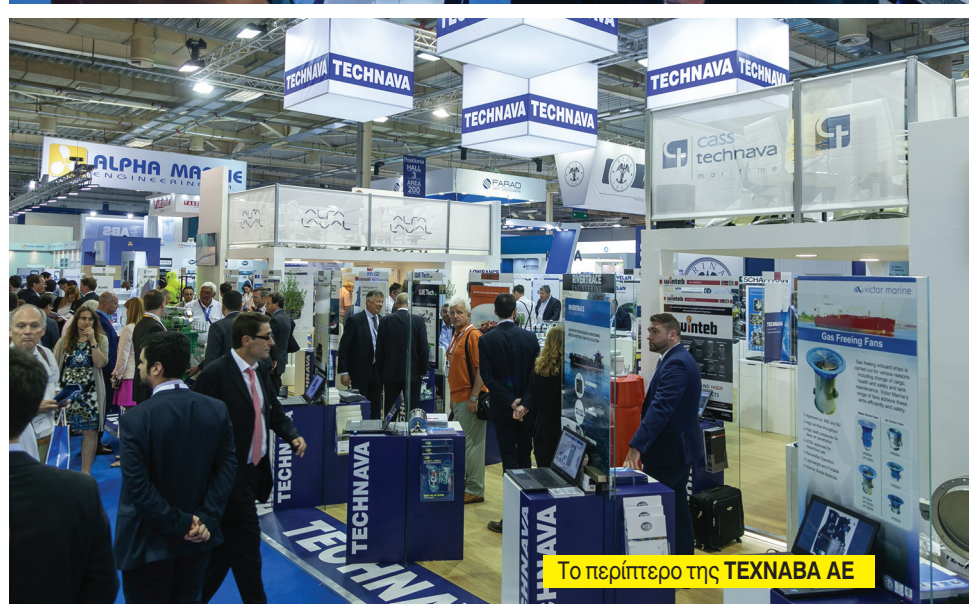
Το περίπτερο της TEXNABA ΑΕ