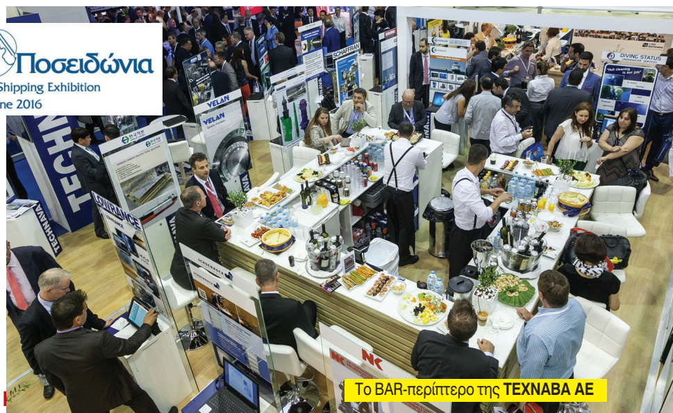
Το BAR-περίπτερο της TEXNABA ΑΕ

Posidonia Ποσειδώνια The International Shipping Exhibition 6-10 June 2016