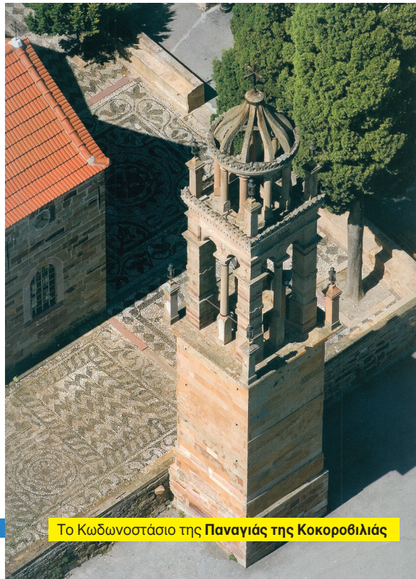
Το Κωδωνοστάσιο της Παναγίας της Κοκοροβιλιάς