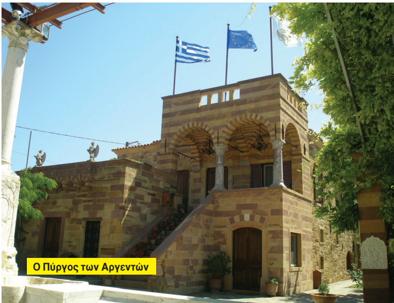
Ο Πύργος των Αργεντιών