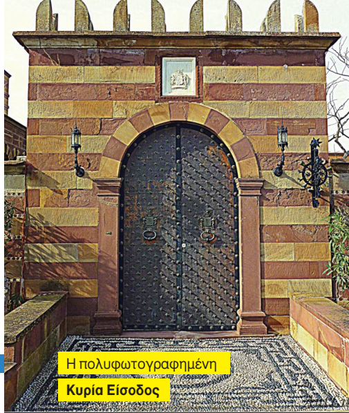
Η πολυφωτογραφημένη Κυρία Εισόδος