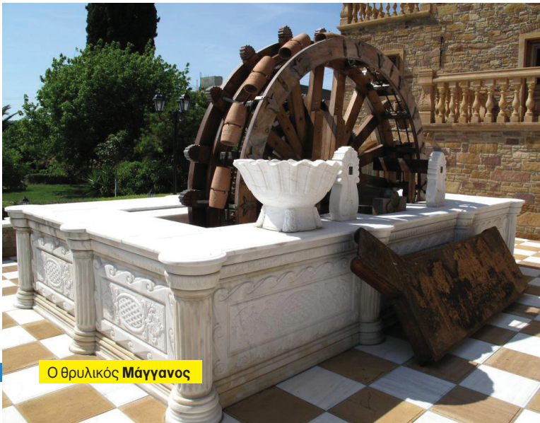
Ο θρυλικός Μάγγανος