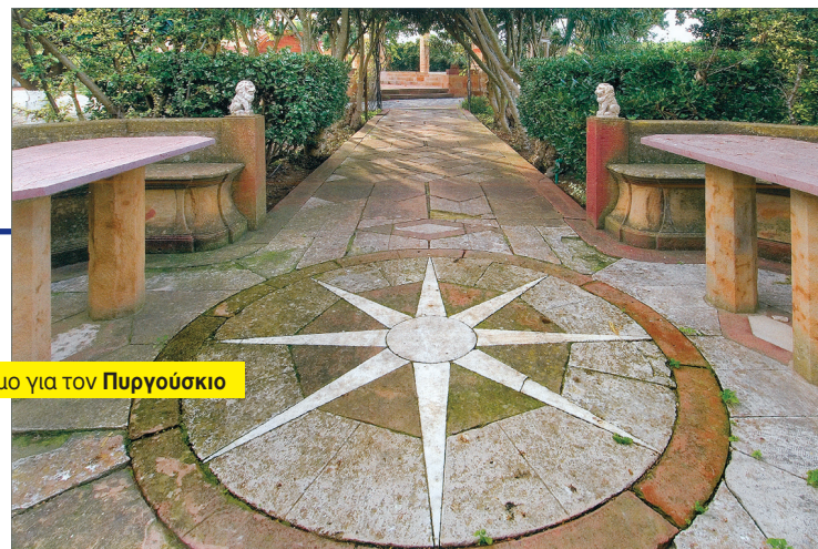
Στον διάδρομο για τον Πυργούσκι

μή και την εμπορική πίστη, εμείς κάνουμε τις μεταφορές μέχρι τα λιμάνια μας και έτσι έχουμε βρει την χρυσή τομή». Έτσι συνέχισαν τις μεταφορές