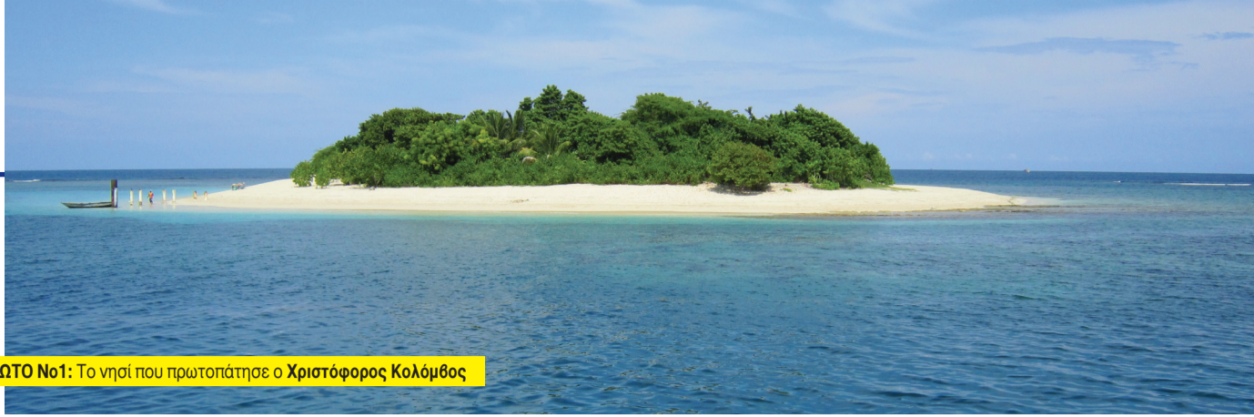
ΦΩΤΟ Νο1: Το νησί που πρωτοπάτησε ο Χριστόφορος Κολόμβος