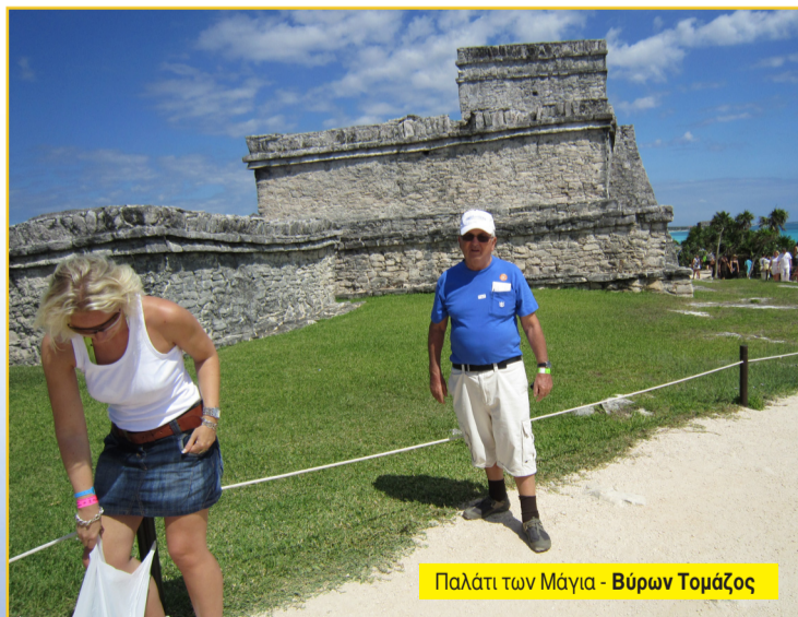
Παλάτι των Μάγια - Βύρων Τομάζος