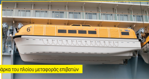
Βάρκα του πλοίου μεταφοράς επιβατών

τική αφού ο κόσμος ζει ακόμη με κουπόνια!