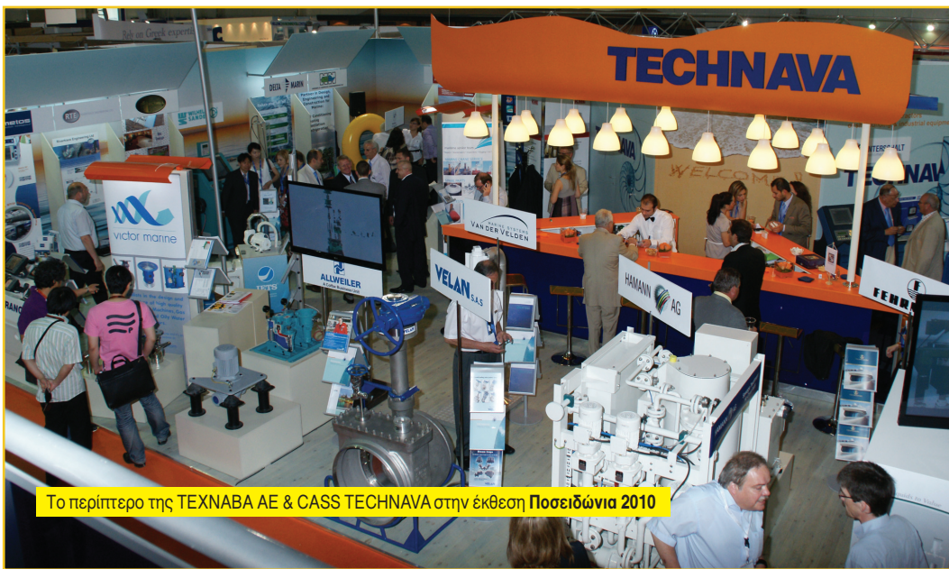
Το περίπτερο της TEXNABA ΑΕ & CASS TECHNAVA στην έκθεση Ποσειδώνια 2010