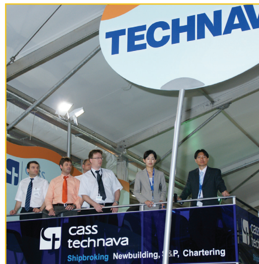
cass technava Shipbroking Newbuilding, S&P, Chartering