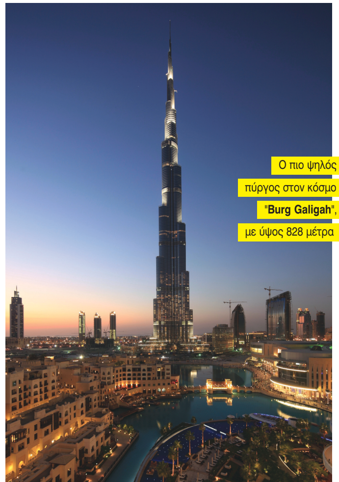
Ο πιο ψηλός πύργος στον κόσμο "Burg Galigah", με ύψος 828 μέτρα