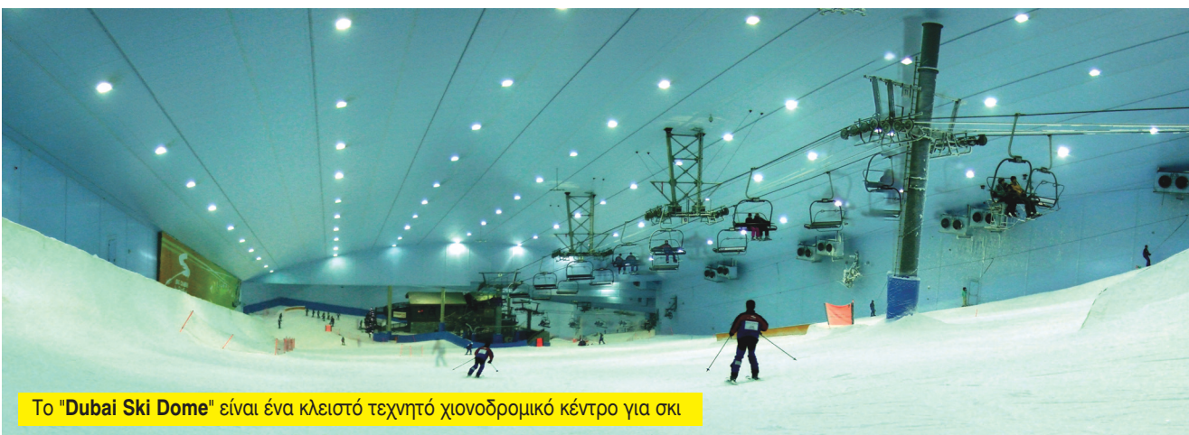
Το "Dubai Ski Dome" είναι ένα κλειστό τεχνητό χιονοδρομικό κέντρο για σκι

σει την αίγλη την παλιά που υπήρχαν διαφορές στα ρολόγια "Rolex" και λοιπά. Όπως είδατε και στα tips που σας είπα, στα ταξίδια δεν αγοράζουμε ακριβά πράγματα γιατί δεν έχουν εγγύηση, είναι δύσκολο να εφαρμοστεί.