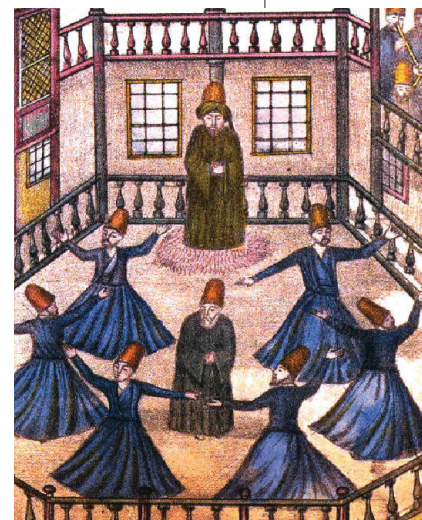
Ο χορός των Δερβίσηδων